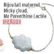
Bijou lait maternel, Micky cloud, Ma Parenthèse Lactée 124,99 €