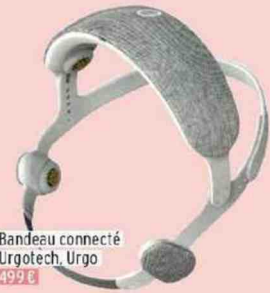
Bandeau connecté Urgotech, Urgo 499 €