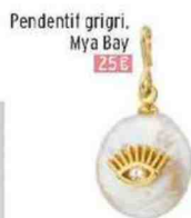
Pendentif grigi, Mya Bay 25 €