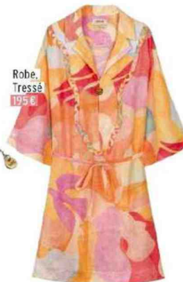
Robe, Tressé 195 €