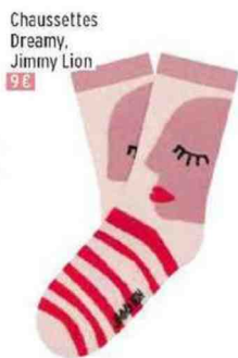
Chaussettes Dreamy, Jimmy Lion 9 €