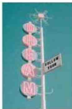
Affiche Follow Your Dream, Junique À PARTIR DE 7,99 €

Soigner son intérieur autant que l'extérieur... et mettre de la couleur dans sa chambre à coucher!