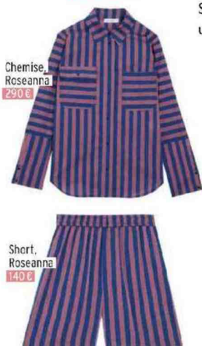
Chemise, Roseanna 290 €