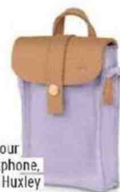
Étui pour smartphone, Fitz & Huxley 49 €