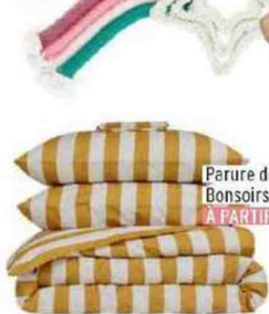
Parure de lit en lin, Bonsairs À PARTIR DE 279 €