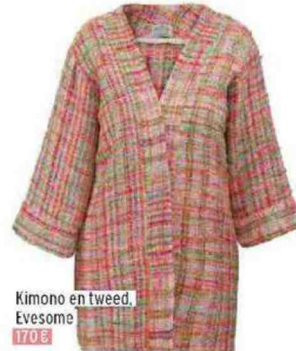
Kimono en tweed, Evesome 170 €