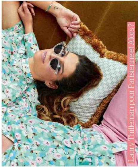
Laury Thilleman pour Parisienne! Alors?