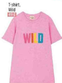
T-shirt, Wild 49 €