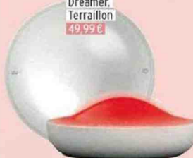
Activateur de sommeil Dreamer, Terrailon 49,99 €