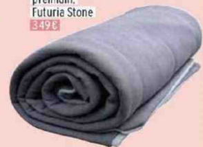
Couverture lestée premium, Futuria Stone 349 €