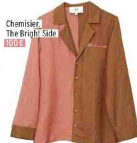
Chemisier, The Bright Side 100 €