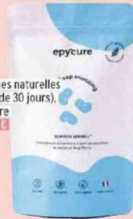
Gommes naturelles (Cure de 30 jours), Epcure 24,90 €